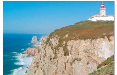
Cabo da Roca

Der Rest des Nachmittages steht Ihnen für eigene Entdeckungen zur freien Verfügung. Abendessen mit Fado-Musik im Restaurant-Café Luso F/A