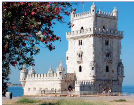
Torre de Belem

R eisen Sie auf den Spuren der Vermächtnisse der einstigen Weltmacht Portugal. Welcher Ausgangspunkt wäre besser geeignet als das faszinierende Lissabon - die Hafenstadt an der Mündung des Tejo, nahe der Unendlichkeit des Meeres. „Portugal ist Lissabon“, so sagt der Volksmund, „der Rest ist Landschaft“. Ohne Zweifel zählt die Stadt der sieben Hügel am Tejo mit zu den herausragenden Metropolen Europas. Sie ist das politische, wirtschaftliche und kulturelle Zentrum des Landes. Lernen Sie auf der ersten Etappe Ihrer Reise die kulturelle und landschaftliche Vielfalt von Lissabon und Umgebung kennen. Über malerische und geschichtsträchtige Orte geht es im Anschluss nach Porto, als einstige Hauptstadt des Landes der ständige „Rivale“ von Lissabon und Zentrum des Weinbaus. Genießen Sie die besondere Atmosphäre der Stadt und unternehmen Sie eine spannende Flussfahrt entlang der durch den Weinbau geprägten Landschaft auf dem Douro.