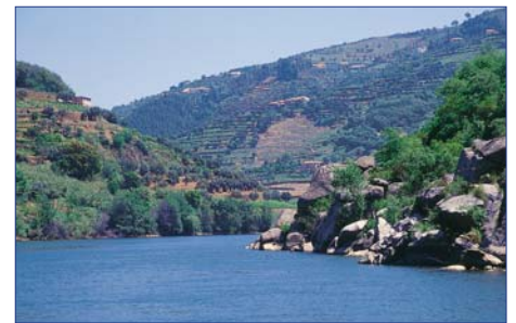
Auf dem Douro