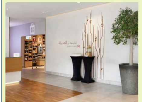
Lobby des Hotels Hilton Garden Inn