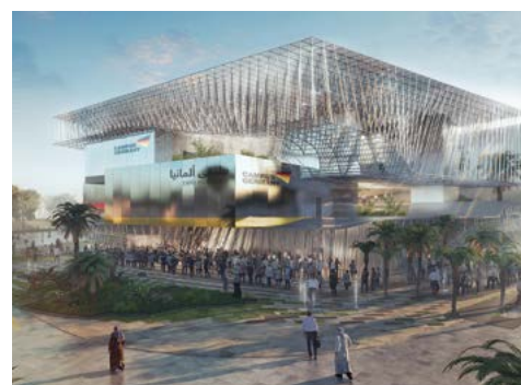
Der deutsche Pavillion

Nutzen Sie für Ihre Anreise zum Flughafen das im Reisepreis enthaltene Rail & Fly-Ticket der Deutschen Bahn (2. Klasse ohne Sitzplatzreservierung). Abends beginnt dann Ihre „Reise in die Zukunft“ mit Ihrem Nonstop-Emirates-Flug. Ankunft in Dubai am frühen Morgen des kommenden Tages.