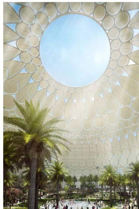
In der Al Wasl Plaza