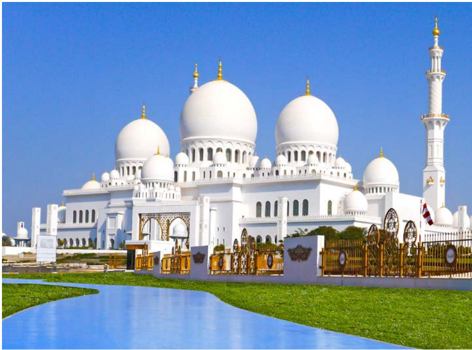
Sheikh-Zayed-Moschee in Abu Dhabi