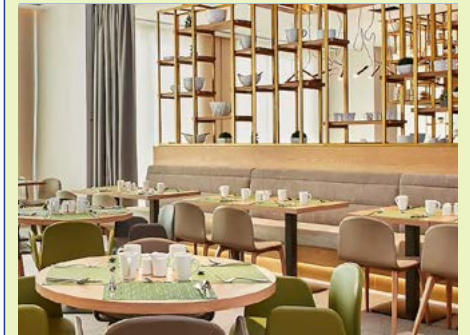
Frühstücksraum im Hilton Garden Inn